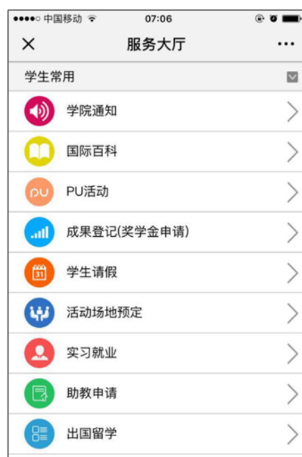
图 1：国际助手服务大厅教师页面 图 2：国际助手服务大厅学生页面