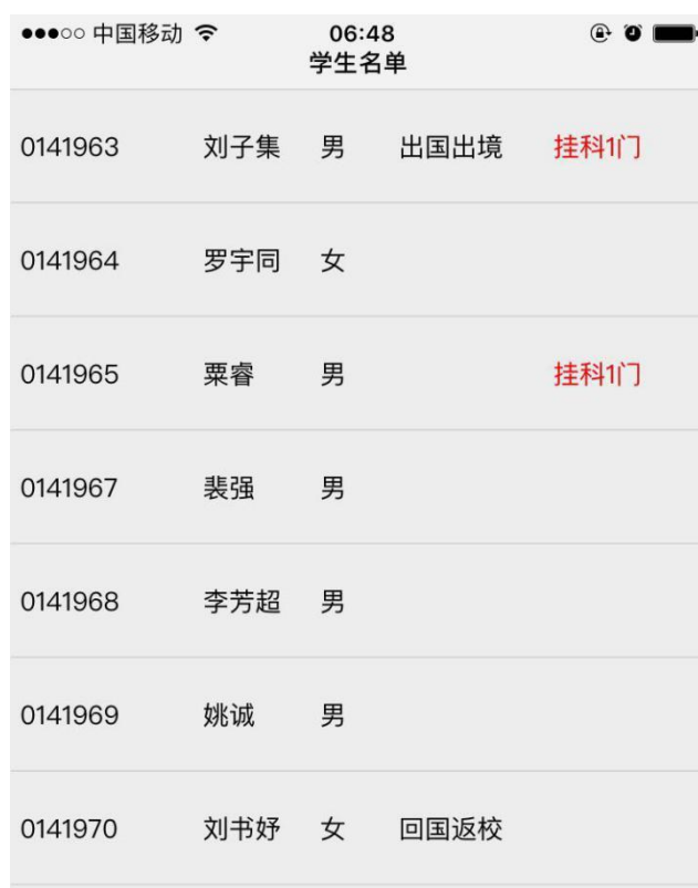
图 11: 班主任可在手机端查看学生基本状态