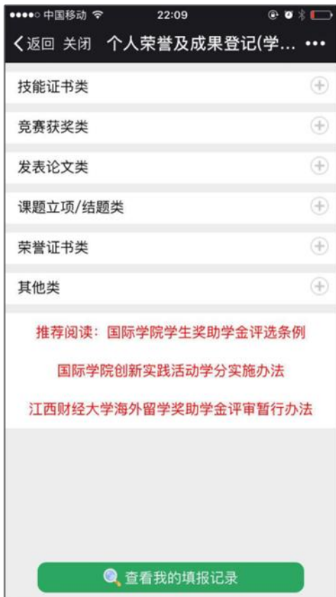
图 14: 学生个人成果登记类别