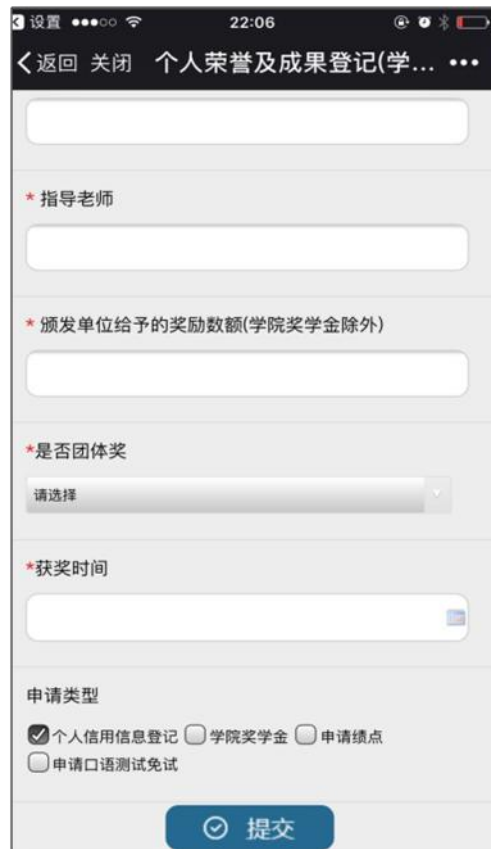
图 15: 学生个人成果登记提交页面