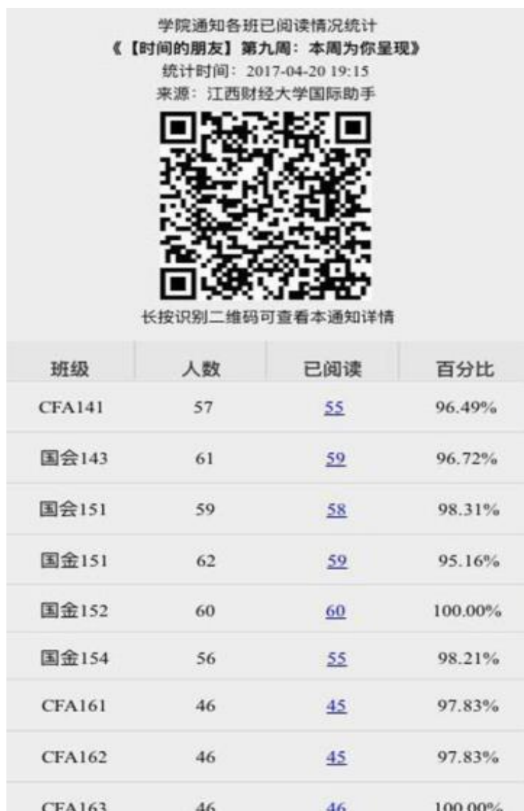
图7：发布的通知可查看到达率及反馈情况