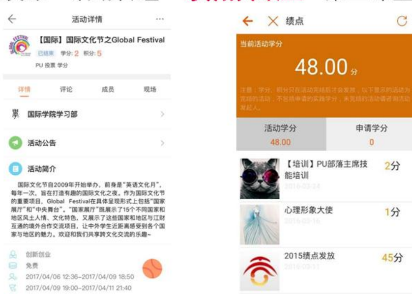
图 5：国际学院第二课堂全流程信息化管理之绩点认证